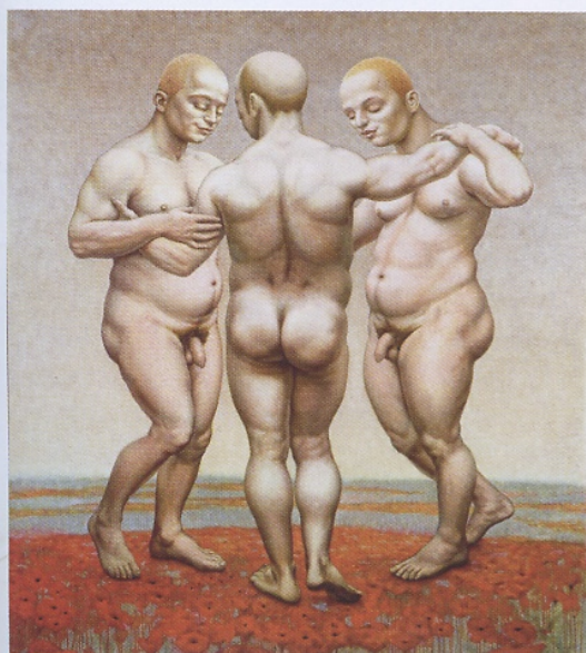
Hoer met Cyklaam II, 1988, olieverf op doek, 200 x 160 cm, Museum MORE, Gorssel

In Amsterdam leerde schrijvers en dichters kennen als Gerrit Komrij en Judith Herzberg. Met Komrij maakte Gordijn in 2009 Binnenste buiten een serie van tien etsen met tien gedichten. Literatuur en kunstgeschiedenis >>